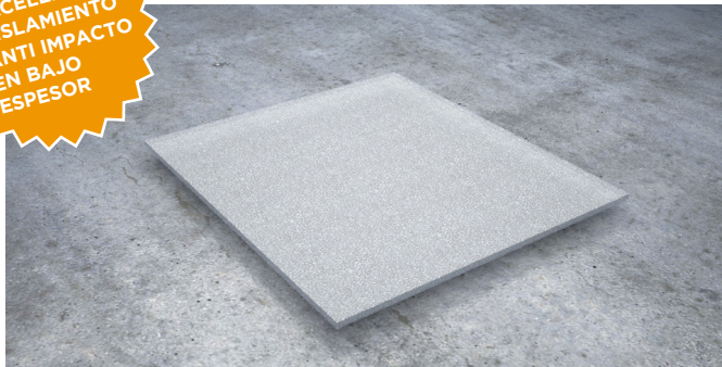
Lámina de espuma de polietileno no reticulada (Foam) apto para suelos flotantes, instalación bajo parquet y forjados para reducción de ruido de impacto.

EXCELENTE AISLAMIENTO ANTI IMPACTO EN BAJO ESPESOR